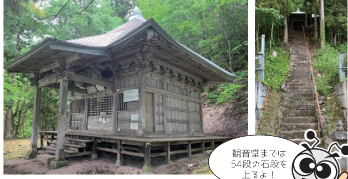
観音堂までは54段の石段を上るよ!

関山観音は会津三十三観音の第24番札所です。本尊の十一面観音像は、徳一大師が会津各地を巡って寺院を建立していた時に作ったものだという説があります。この十一面観音は秘仏で、毎年8月9日に御開帳されます。お堂が建てられた時期は不明ですが、元々は平地にあった観音堂を、寛政2年(1790年)に、集落を見下ろす山の中腹を切り開いて移されたと言われています。この観音堂は、一生に一度だけの願いが叶うとされて篤く信仰されています。ご詠歌は「散る花を止むる氷玉の関の山雲降り登る道は一筋」