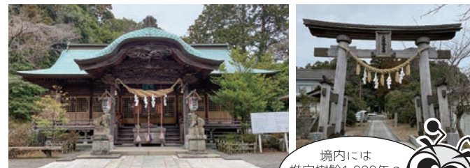
■所在地：いわき市平菅波宮前26

奈良時代の718年、福島県浜通りと宮城県亘理郡にかけて石城国（いわきのくに）がつくられた時に、大國魂神社も祭られたとされています。927年、醍醐天皇の御世に撰修された延喜式神名帳は、当時「官社」に指定されていた全国の神社の一覧ですが、いわき市にある7つの神社の名前もあります。大國魂神社は、その磐城郡七座の筆頭にあげられている由緒ある神社です。主祭神は大黒様とも呼ばれる大己貴命（おおなむちのみこと）で、五穀豊穡、縁結び、商売繁盛の神様です。神社に伝わる国魂文書は県指定重要文化財で、現在の社殿は江戸時代1679年の建立で市の有形文化財です。年3回奉納される「大和舞」は出雲流神楽であり、太々神楽ともいわれています。記紀の神話をはやし方の音に合わせて踊るもので、いわき市の無形重要文化財に指定されています。